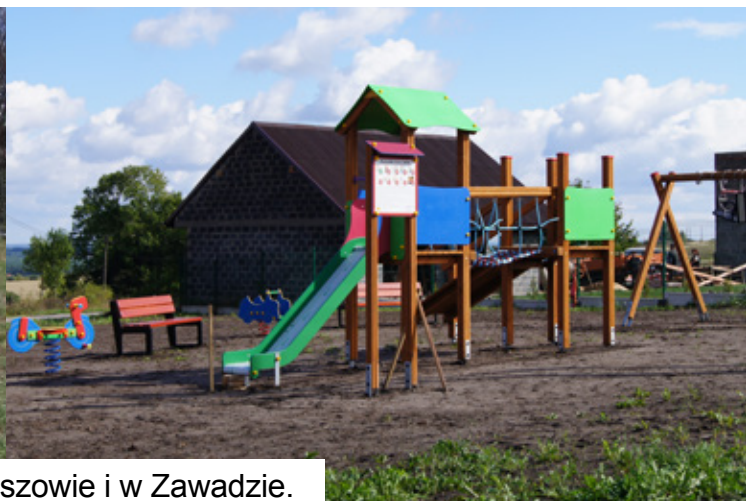
Nowe place zabaw w Najdyszowie i w Zawadzie.