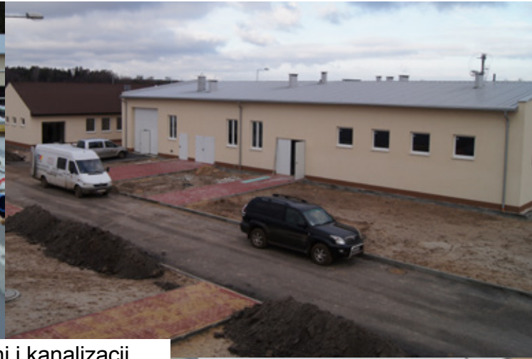
Budowa oczyszczalni i kanalizacji.