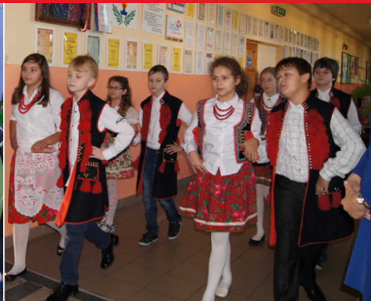
Mała przeczycka szkoła w wielkim projekcie str. 13