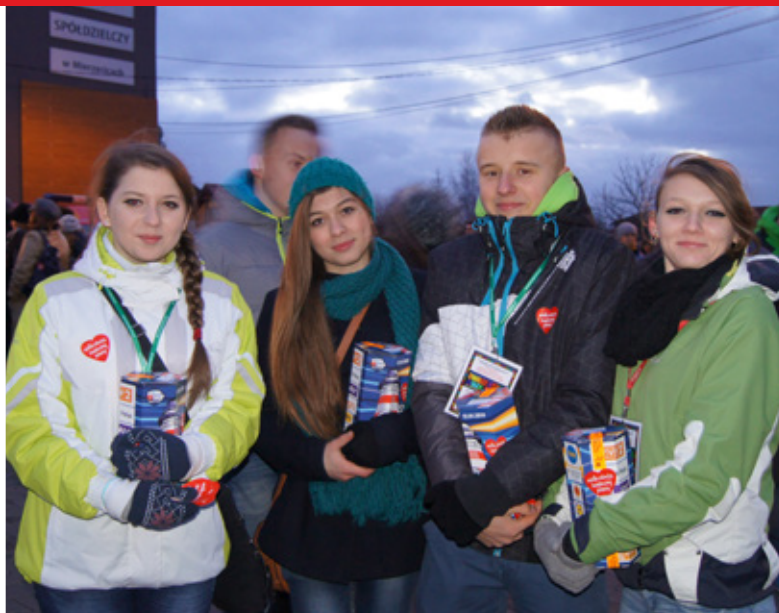
22. Finał WOŚP w Gminie Mierzęcice str. 11

WAŻNA INFORMACJA DLA MIESZKAŃCÓW GMINY MIERZĘCICE DOTYCZĄCA BUDOWY PRZYŁĄCZY KANALIZACYJNYCH DO BUDYNKÓW str. 15