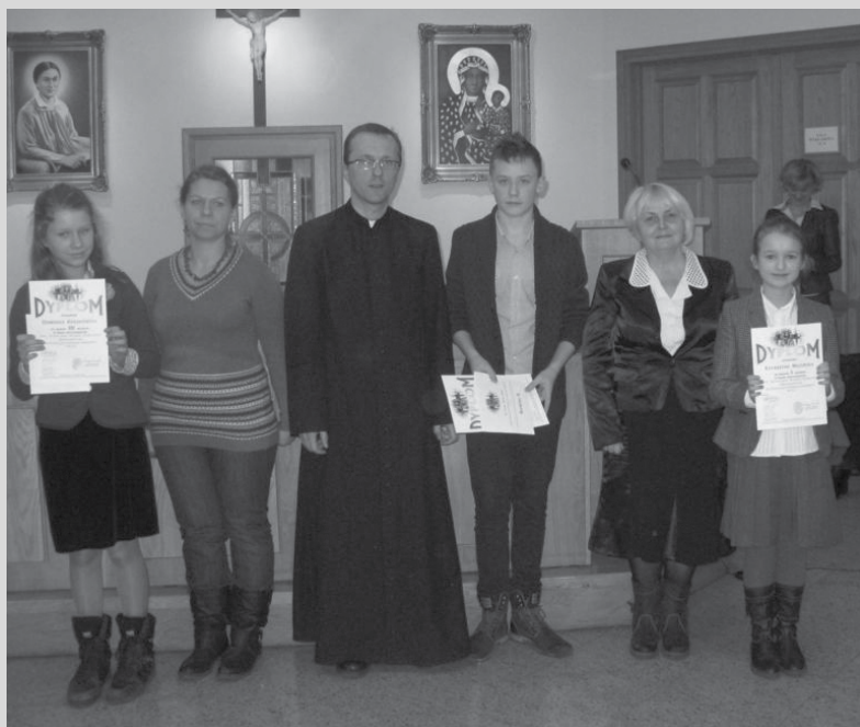
Laureaci konkursu Wiedzy Biblijnej wraz z opiekunami.