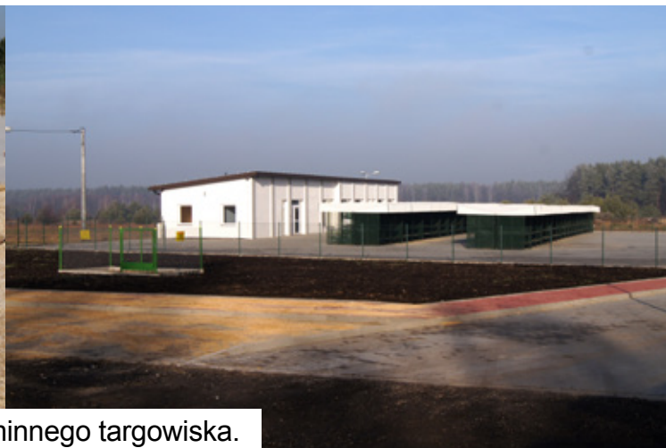
Remont i modernizacja gminnego targowiska.