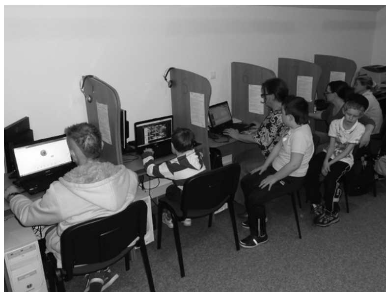
Szkolenie mieszkańców Gminy z zakresu podstawowej obsługi komputera.

Przedsięwzięcie to udało się zrealizować dzięki zakwalifikowaniu się Gminy Mierzęcice do realizacji projektu pn. "Przeciwdziałanie wykluczeniu cyfrowemu w Gminie Mierzęcice", współfinansowanego ze środków Unii Europejskiej ze środków Europejskiego Funduszu Rozwoju Regionalnego w ramach Działania Operacyjnego Innowacyjna Gospodarka 2007 – 2013, działanie 8.3 Przeciwdziałanie wykluczeniu cyfrowemu – eInclusion. Na realizację tego projektu Gmina Mierzęcice otrzymała dotację w wysokości 278 470,00 zł (100 procent dofinansowania)