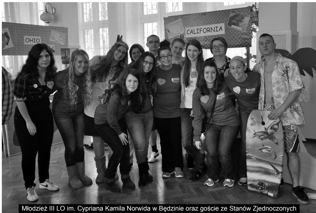
Młodzież III LO im. Cypriana Kamila Norwida w Będzinie oraz goście ze Stanów Zjednoczonych

Warto zatem zastanowić się nad pracą w branży turystycznej. To jedna z najprężniej rozwijających się gałęzi gospodarki. Stale wzrasta zapotrzebowanie na profesjonalną i wykwalifikowaną kadrę, pojawiają się nowe zawody, niektóre bardzo dobrze płatne np. menedżer przedsiębiorstw i organizacji turystycznych, animator rekreacji, moderator turystyki. Rozwija się turystyka motywacyjna, kulinarna, agroturystyka.