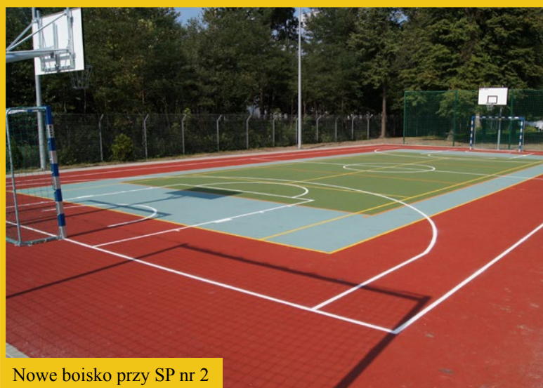
Nowe boisko przy SP nr 2

W 2013 roku uczniowie ze Szkoły Podstawowej im. Marii Konopnickiej w Przeczcicach, rozpoczęli udział w międzynarodowym programie „Uczenie się przez całe życie”, którego celem jest rozwijanie wśród młodzieży wiedzy o różnorodności kultur i języków europejskich oraz zrozumienia jej wartości.