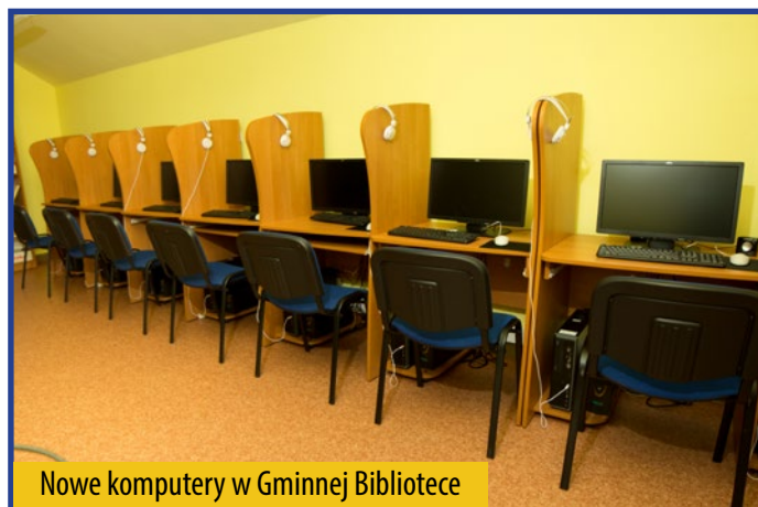
Nowe komputery w Gminnej Bibliotece

W ramach tego projektu, zakupiono 53 zestawy komputerowe wraz z niezbędnym oprogramowaniem i dostępem do Internetu oraz 3 drukarki. 35 komputerów trafiło do rodzin o najniższych dochodach i osób niepełnosprawnych, pozostały sprzęt zainstalowano w Gminnej Bibliotece Publicznej i Gminnym Ośrodku Kultury.