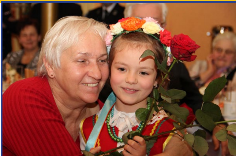
Dzień Seniora w gminie Mierzęcice