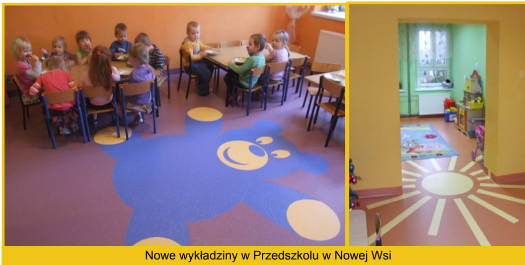
Nowe wykładziny w Przedszkolu w Nowej Wsi

W Zespole Szkolno - Przedszkolnym w Nowej Wsi, wykonano nowe posadzki i odnowiono sale dla wychowanków. Obok placówki działa otwarty plac zabaw dla dzieci, przy którym uzupełniono ogrodzenie ze środków pochodzących z funduszu sołectkiego.