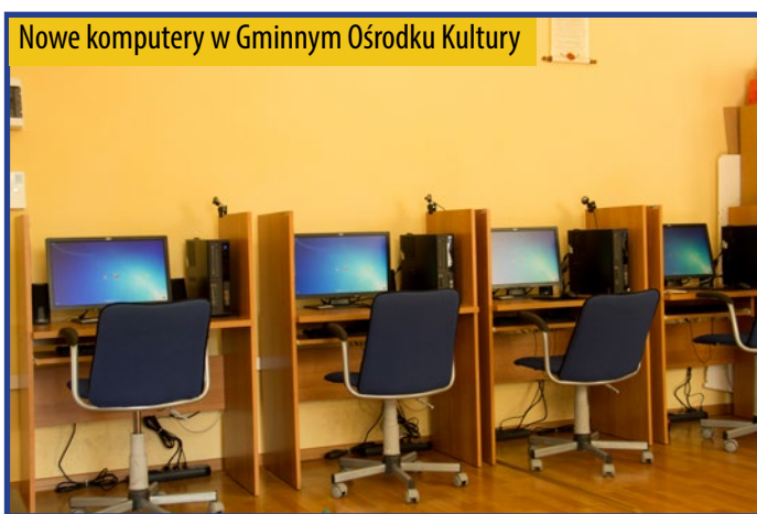
Nowe komputery w Gminnym Ośrodku Kultury

Elementem projektu były także szkolenia dla 160 osób z zakresu podstawowej obsługi komputera i korzystania z zasobów globalnej sieci.