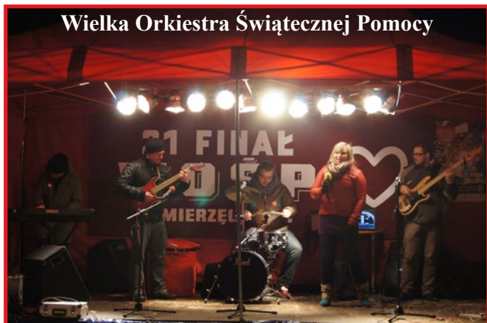
Wielka Orkiestra Świątecznej Pomocy

WOŚP, Tour de Pologne, Dzień Kobiet i wiele innych