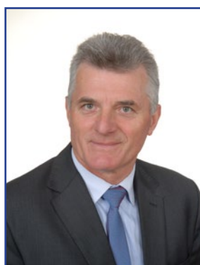
Jacek Biedroń Okręg wyborczy nr 6