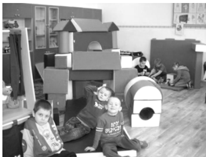
Nowe atrakcje świetlicy szkolnej

Udział w programie „Radosna szkoła” sprawił, iż nasza placówka wyszła naprzeciw oczekiwaniom uczniów i rodziców. Najmłodsi i starsi podopieczni mają stworzone warunki do tego, aby pozosta-