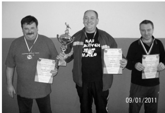
Triumfatorzy w kategorii wiekowej powyżej 18 lat