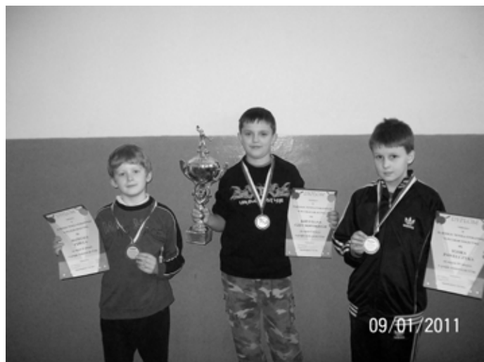
Zwycięzcy w kategorii wiekowej do lat 12