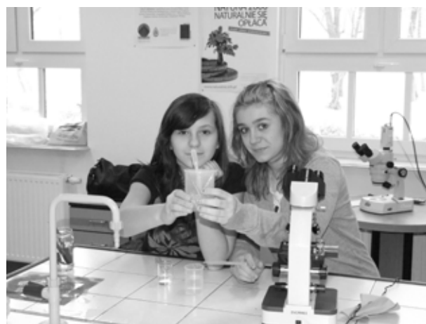
Podczas warsztatów ekologicznych