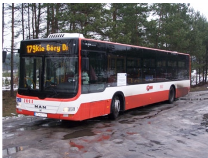
Nowy autobus linii 179 Mierzęcice - Tarnowskie Góry

Każdy z zakupionych autobusów będzie wyposażony w dyspozytorski system pozycjonowania pojazdów, który ułatwi obsługę