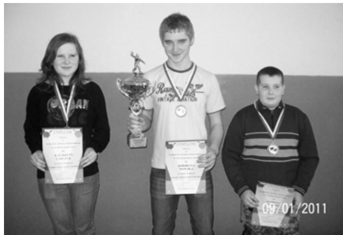
Najlepsi w kategorii wiekowej od 13 do 18 lat