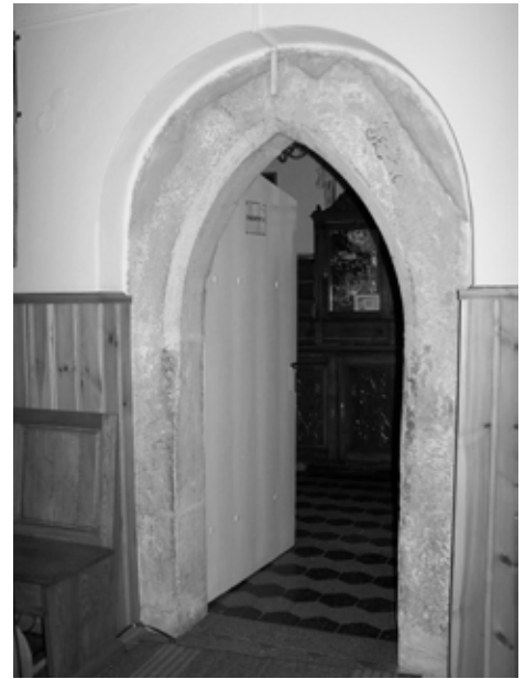
Gotycki portal - najstarszy fragment targoszyckiej świątyni

O ile nie wiemy nic o pogarszającym się stanie kościoła i jego wnętrza do XVII w. to już przekazy z XVIII w. informują nas o złym stanie budowli. Tak też u schyłku XVIII w., zaniepokojony wyglądem świątyni biskup krakowski i ksiądz siewierski Kajetan Sołtyk, jako patron tegoż kościoła, nakazał go remontować. Temu biskupowi zawdzięcza się także przebudowę kościoła św. Macieja Apostoła