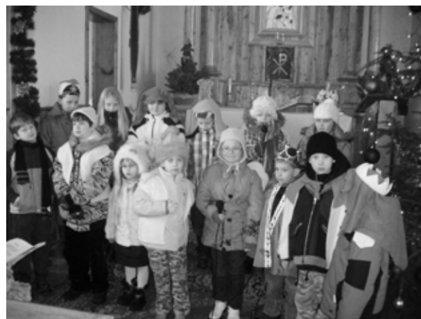
Tradycyjne jasełka w Boguchwałowicach