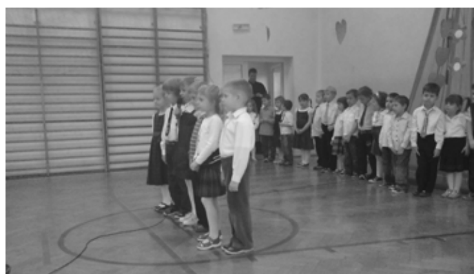
Program artystyczny dla babci i dziadka