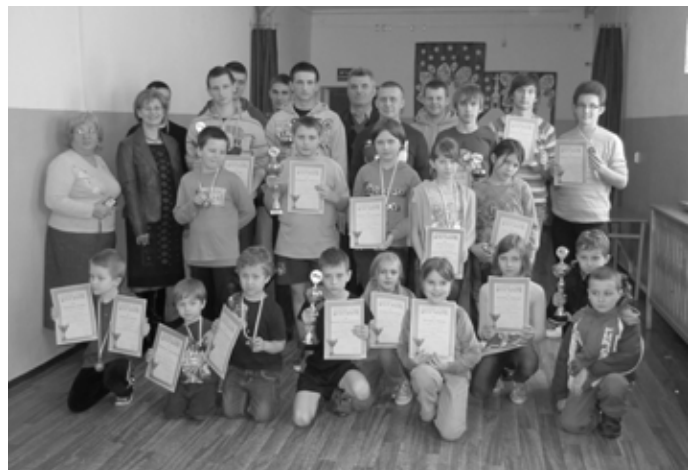
Laureaci tenisowych zmagających z Toporowic