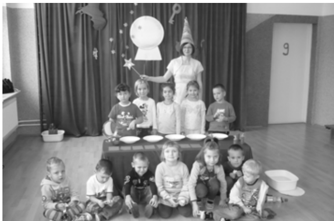
Andrzejkowe wróżby przedszkolaków z Mierzęcic