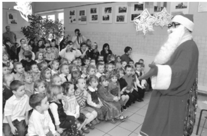
Długo oczekiwany gość zawitał do nowowiejskiego przedszkola