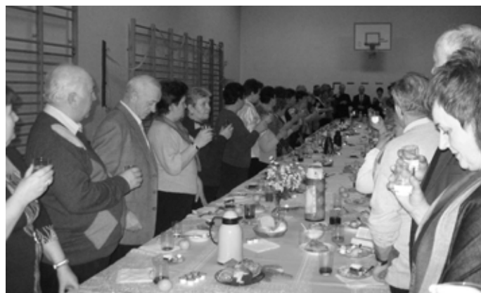
Opłatkowe spotkanie nowowiejskich emerytów