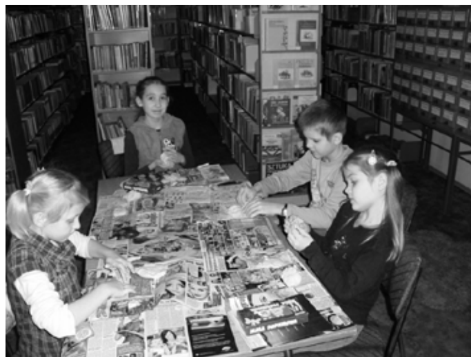
Ferie w filii bibliotecznej w Mierzęcicach Osiedlu

Zajęcia dla dzieci zostały zorganizowane również w trzech filiach bibliotecznych: w Przeczycach, Toporowicach i Mierzęcicach Osiedlu. Mali uczestnicy brali udział w różnorodnych zajęciach plastycznych, dla swoich ukochanych babci i dziadków wykonywały kolorowe laurki, bawiły się masą papierową, składały papier techniką orgiami, a przy użyciu różnych rodzajów makaronu wykonywały