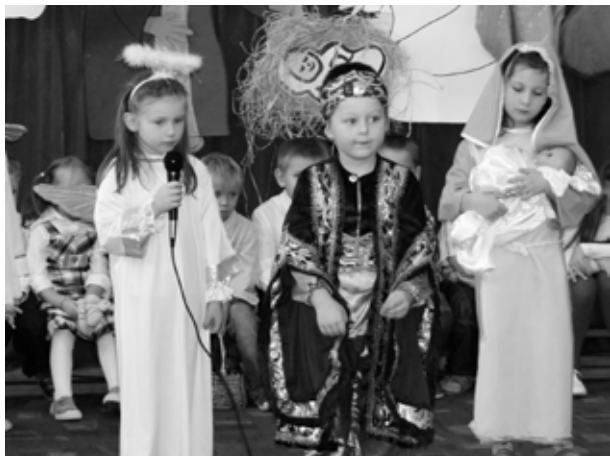
Jasełkowy spektakl mierzęcickich przedszkolaków