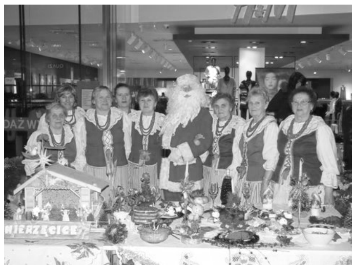
Bożonarodzeniowe stoisko KGW Mierzęcice