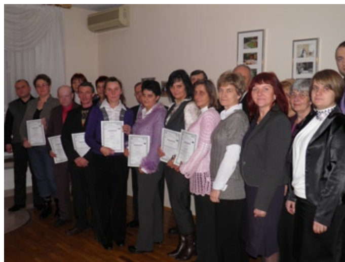
Uczestnicy projektu z certyfikatami