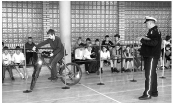
Tor przeszkód sprawiał zawodnikom sporo trudności