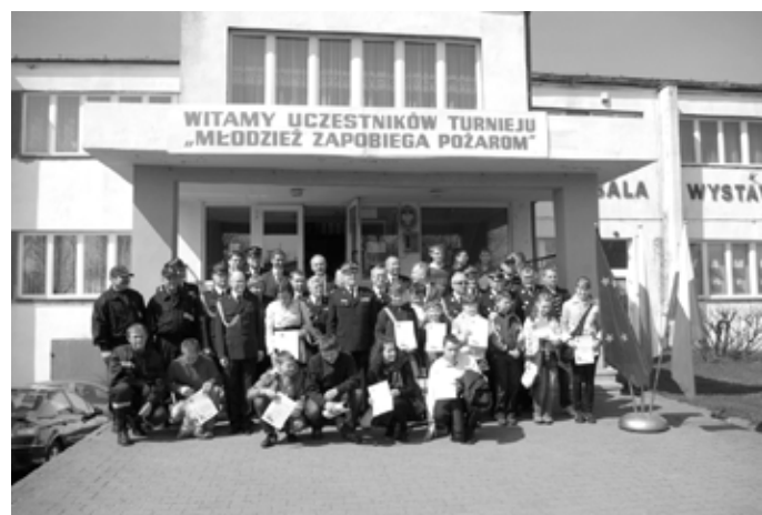
Reprezentantka Mierzęcic godnie reprezentowała gminę i powiat będziński w wojewódzkich eliminacjach turnieju młodzież zapobiega pożarom