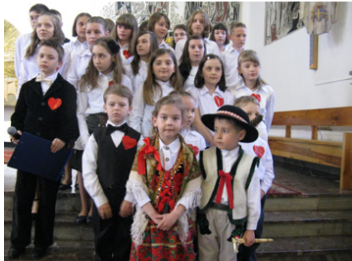
Uczniowie z SP nr 2 w Mierzęcicach Osiedlu podczas spektaklu prezentowali się naprawdę pięknie