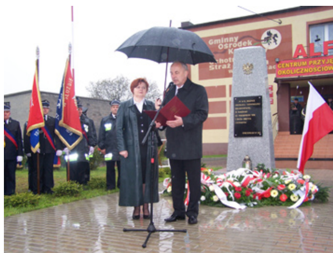
Obchody Konstytucji 3-go Maja pod mierzęcickim obeliskiem odbudowanym dla upamiętnienia 10. rocznicy odzyskania niepodległości

W tym roku cała Polska świętowała okrągłą 220. rocznicę uchwalenia Konstytucji 3-go Maja. Ten ważny w dziejach naszego kraju dzień obchodzono również w patriotycznym duchu na terenie gminy Mierzęcice. Z okazji przypadającego 4 maja Dnia Strażaka