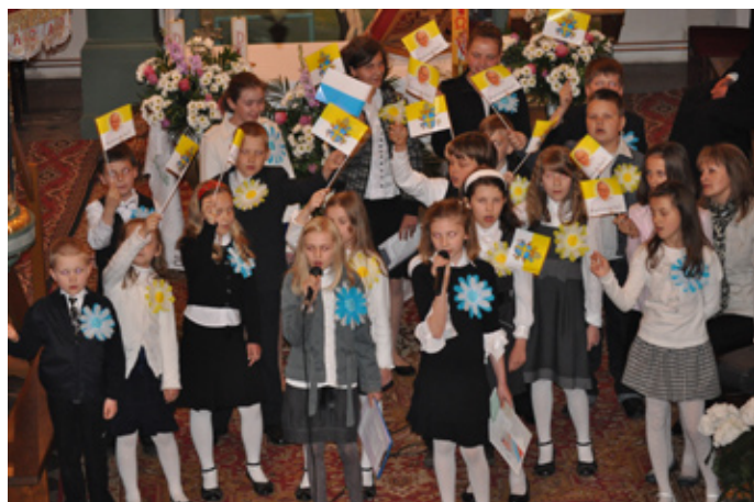
Wychowankowie SP w Toporowicach z wielkim wzruszeniem prezentowali postać Jana Pawła II