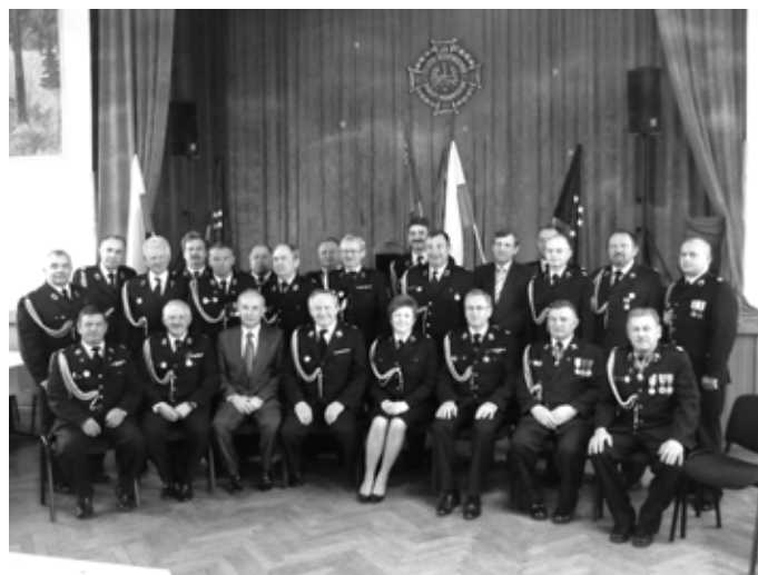
Uczestnicy i goście Zjazdu Oddziału Gminnego Związku Ochotniczych Straży Pożarnych RP w Mierzęcicach

Wykaz członków władz Oddziału Gminnego Związku OSP RP, delegatów na Zjazd Oddziału Powiatowego ZOSP RP i przedstawicieli do Zarządu Oddziału Powiatowego Związku.