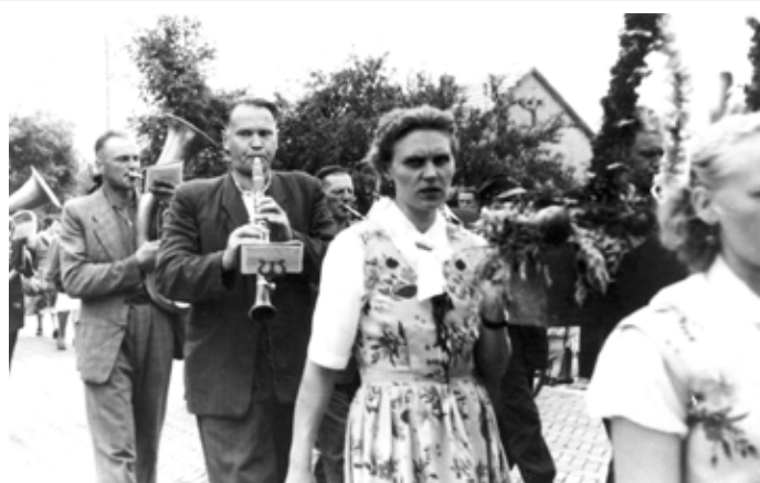
Grając do Częstochowy (1948)

Życie religijne mieszkańców okolicznych wsi miało przez wieki „społeczne oblicze”, wyrażające się w zbiorowych modlitwach w domu, zbiorowym chodzeniu do kościoła, zbiorowym uczestnictwie w pielgrzymkach do miejsc świętych, w zbiorowym obchodzeniu pól itd. Ostracyzm moralny społeczności wioskowych, wyrażający się w surowym potępianiu jednostek nieprzestrzegających tradycyjnych zwyczajów religijnych posiadał cha-