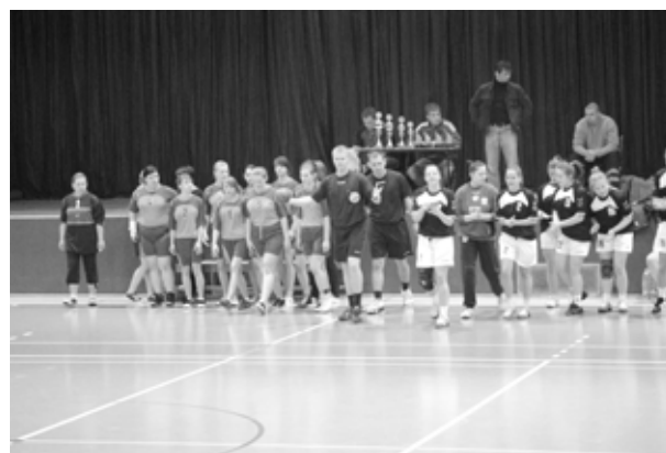
Gimnazjalistki z Nowej Wsi przed meczem w czasie finałów wojewódzkich

28 kwietnia spotkały się w Sosnowcu w hali sportowej „Dorjan” w półfinałach wojewódzkich cztery drużyny reprezentujące gminy: Sosnowiec, Irządze, Częstochowę i Mierzęcice. Rozgrywki były na bardzo wysokim poziomie, każda drużyna pokazała, że potrafi walczyć sportowo, z ogromnym zaangażowaniem i wolą zwycięstwa. Nasze dziewczęta swój pierwszy mecz z drużyną z Sosnowca wygrały i spotkały się w meczu o pierwsze miejsce z drużyną reprezentującą rejon Częstochowy. Ten mecz, jako najbardziej emocjonujący, na długo zostanie w pamięci wszystkich uczestników rozgrywek. Po pełnej zaangażowania - ze strony obu drużyn walce, czę-