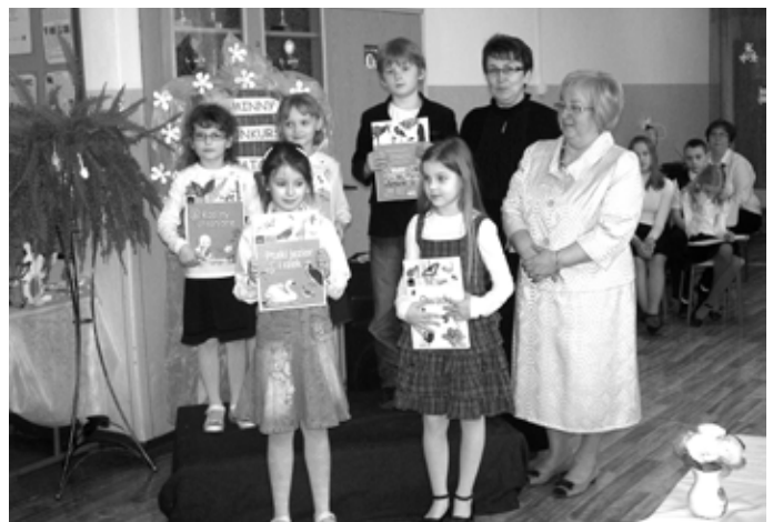
Zwycięzcy konkursowych zmagania z nagrodami książkowymi

Przesłuchania tradycyjnie odbywały się w czterech grupach wiekowych. Na początku zaprezentowali najmłodszy - dzieci z oddziałów przedszkolnych, klas I i II, potem wiersze recytowali uczniowie klas III i IV, następnie młodzież klas V i VI. Artyści mimo tremy potrafili bardzo dobrze zaprezentować na scenie swoje umiejętności. Zauroczyli tym nie tylko swoich najbliż-