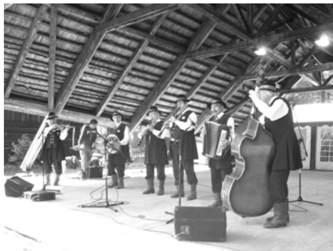
Kapela Regionalna podczas tegorocznych „Wici” w Chorzowie