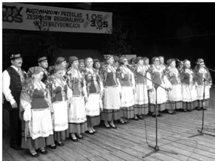
Występ „Mierzęcanki” podczas przeglądu w Zebrzydowicach