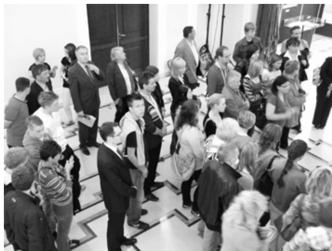
Wizyta w Sejmie była dla mieszkańców gminy okazją by zweryfikować swoje wyobrażenia o pracy Parlamentu z rzeczywistością

Po pierwszym etapie zwiedzania zebrani przeszli na galerię sejmową, gdzie mieli okazję przysłuchać się pytaniom zadawanym