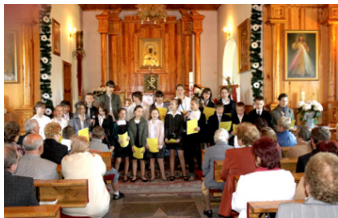
Młodzi artyści wspominali postać Jana Pawła II w boguchwałowickiej kaplicy