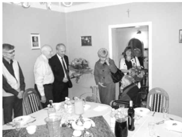
Spotkanie przedstawicieli władz gminy z dostojnym jubilatą było bardzo wzruszające