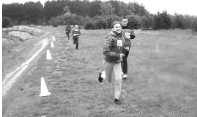
Finisz biegu w kategorii szkół podstawowych