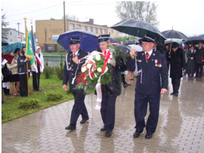
W uroczystości mimo chłodu i ulewnego deszczu wzięło udział wielu mieszkańców gminy

Z okazji zbliżającego się Dnia Matki i Dnia Dziecka wszystkim Mamom i ich Pocięchom mieszkającym w naszej gminie radości na co dzień i samych pogodnych chwil