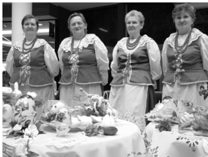
Panie z KGW Mierzęcice zrobiły ogromne wrażenie i na gospodarzach wielkanocnych „Regionaliów” i na odwiedzających

świątecznym i zaproszenie na kolejny świadczą o żywym zainteresowaniu szeroko pojętym folklorem. Jest to doskonała forma promocji nie tylko rodzimej kultu-