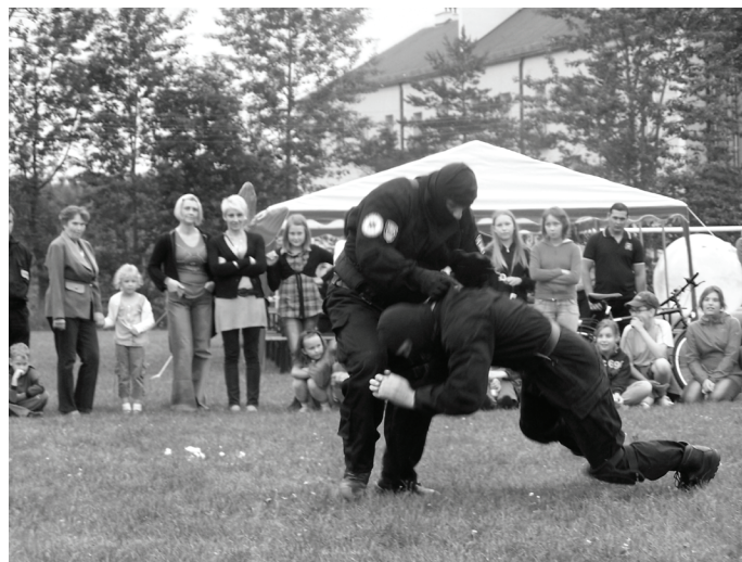
Prezentacja Grupy Interwencyjnej SW.

towia Ratunkowego z Przecyzki przeprowadzili „na sucho” akcję ratowniczą oraz konkursy dla dzieci, które cieszyły się ogromną popularnością. „Wodniacy” uczyli także zasad udzielania pierwszej pomocy. Pierwsza Śląska Brygada Raketowa Obrony Powietrznej z Bytomia zaprezentowała wystawę sprzętu wojskowego i przeprowadziła konkurs strzelniczy. Wojskowa Komenda Uzupełnień z Będzi-