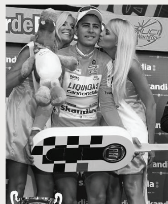
Jeden ze zwycięzców wyścigu.