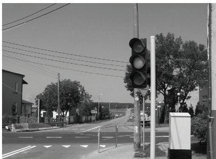
Nowa sygnalizacja świetlna.