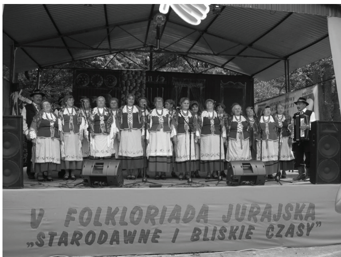
Występ zespołu „Mierzęcanki” podobał się i jurorom i widzom.