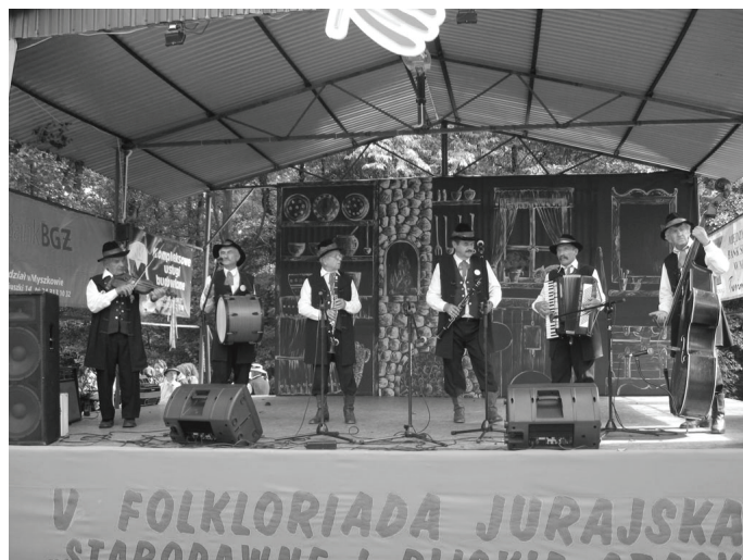
Kapela „Mierzęcice” wywalczyła na III Przeglądzie Zespołów Folklorystycznych w Żarkach Letnisko wysokie, II miejsce.