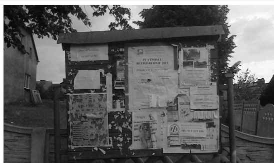
Wymienione tablice informacyjne, zdjęcia 1 i 3. Dla porównania stara tablica zdjęcie 2.