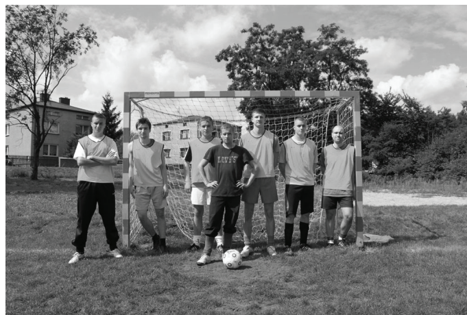
Drużyny pozowały do pamiątkowych fotografii.