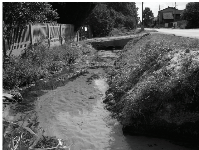
Uporządkowane pobocze przy ul. 21 Stycznia. Udrożniono także rowy odprowadzające ciek wodny do Przemszy.