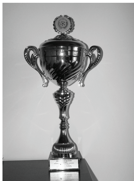
Za awans do ligi okręgowej drużyna „Strażaka” otrzymała wspaniały puchar.