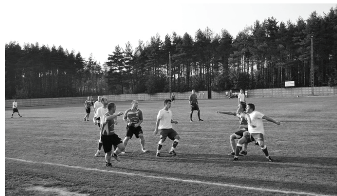
W 3 kolejce GKS „Strażak” Mierzęcice zremisował 2:2 z GKS „Urania” z Rudy Śląskiej.