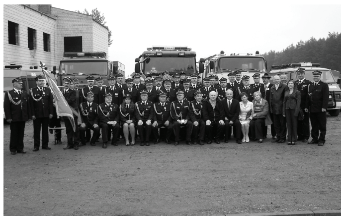
W spotkaniu uczestniczyło wielu znamienitych gości.