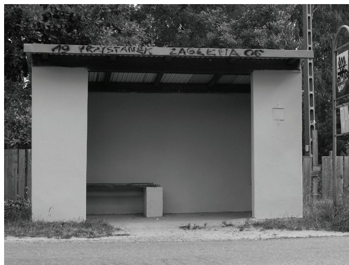
Po raz kolejny odnowiony przystanek przy ul. 21 Stycznia w Przeczycach, na razie prezentuje się lepiej.