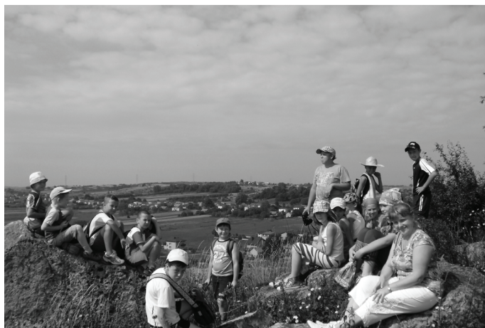
Projekt „Co zobaczysz z Ostrej Góry?” to wakacyjna oferta Stowarzyszenia Społeczno-Kulturalnego Przyjaciół Toporowic.