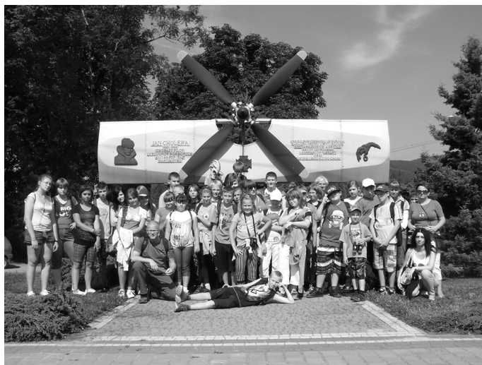
Na zakończenie wycieczki na Równicę wykonano wspólną, pamiątkową fotografię.