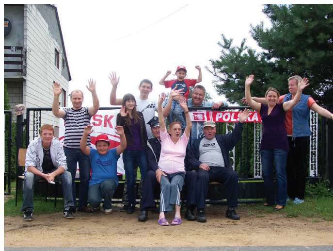
Mieszkańcy dopingowali kolarzy wzdłuż całej trasy.