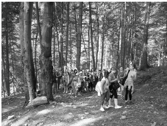
Szlaki Beskidu Śląskiego, mimo że często bywają męczące zwłaszcza w czasie upałów, robią wielkie wrażenie na turystach.