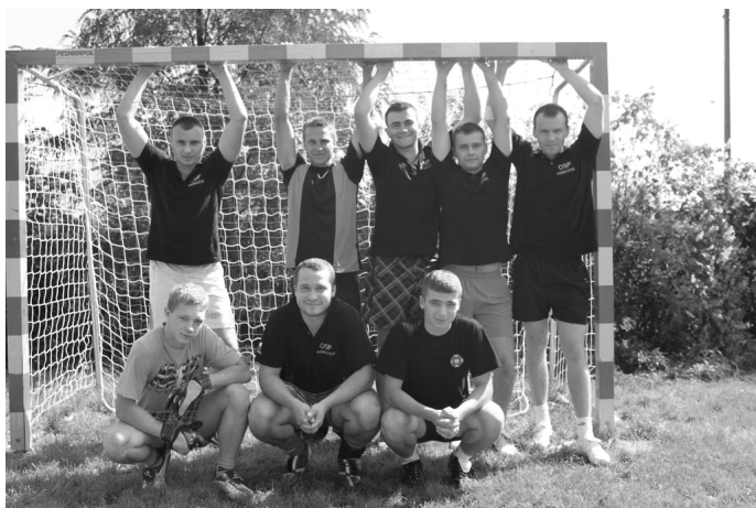
Drużyny pozowały do pamiątkowych fotografii.

postanowili zorganizować kolejną edycję turnieju w przyszłym roku. Wieczorem 13 sierpnia, już bez sportowych emocji, zawodnicy i kibice bawili się na zabawie ta- necznej przy remizie OSP Bogu- chwałowice. I Turniej Piłki Nożnej Drużyn OSP o Puchar Wójta Gminy Mierzęcice jest przykładem tego, że nawet amatorska rywalizacja sportowa może spotkać się z wielkim uzna- niem kibiców. Organizatorzy za- wodów dołożyli zresztą wszelkich starań, aby na turnieju panowała serdeczna, rodzinna atmosfera.