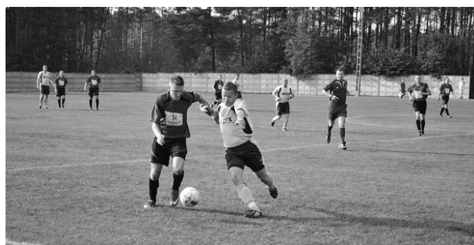
W 4 kolejce sezonu 2011/2012 „Strażak” pokonał „Piasta” Ożarówicę.

odnotowały GKS „Strażak” Mierzęcice, RKS „Grodziec” Będzin, LKS „Przemśka” Siewierz. Jeśli chodzi o największą liczbę zwycięstw na wyjeździe także najwięcej - 13 - odnotował „Strażak” Mierzęcice. Nic dziwnego, że takie wyniki dały drużynie „Strażaka” awans do ligi okręgowej.