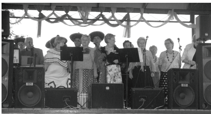
„Uroczystość Odpustowa” i „Impreza Promocyjno – Kulturalna” w Toporowicach okazały się prawdziwym świętem miejscowości.