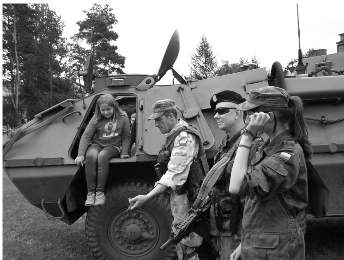
Prezentacja Grupy Rekonstrukcji Historycznej „Steel Bastards”.

Piknik odwiedzili również właściciele starych motocykli, którzy z