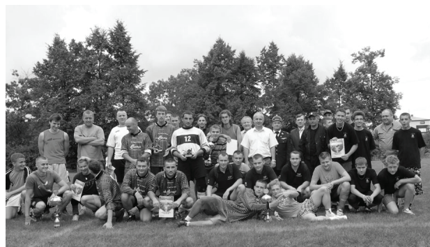
Uczestnicy I Turnieju Piłki Nożnej Drużyn OSP o Puchar Wójta Gminy .