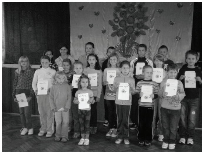
W czasie spotkań pod hasłem „Pożytecznie i wesoło” wszyscy naprawdę dobrze się bawili.

ze wsi Toporowice i Sadowie - ul. Daleka. Udało się to dzięki organizowaniu działań sprzyjających poznawaniu i promocji rodzinnej miejscowości, jej przyrody, tradycji oraz życia społecznego. Dotacja otrzymana z Fundacji Wspomagania Wsi, jak również wkład finansowy stowarzyszenia pozwoliły na organizację wielu ciekawych zajęć, które rozwijają zainteresowania i umiejętności najmłodszych. W programie znalazły się zajęcia plastyczne zakończone prezenta-