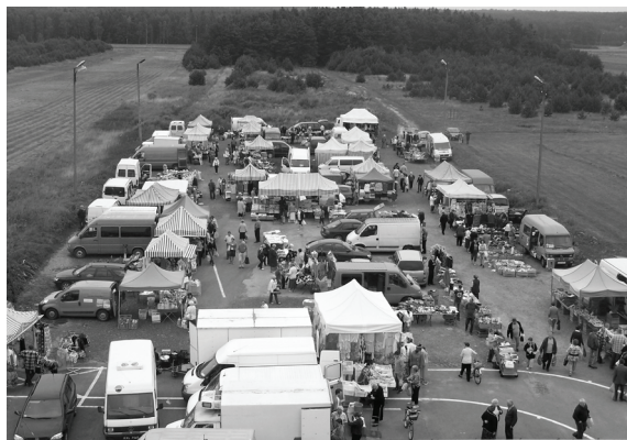
Targowisko w Mierzęcicach czeka gruntowna przebudowa.

„Panorama Gminy Mierzęcice” Bezpłatny Miesięcznik Informacyjny