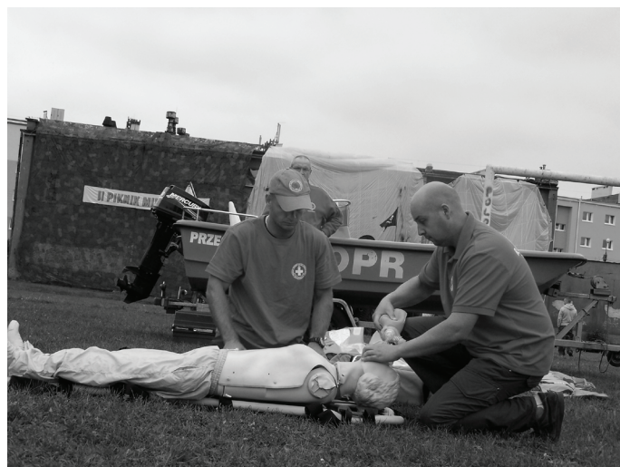
Wielką atrakcją były liczne pokazy, prezentacje i akcje ratunkowe.