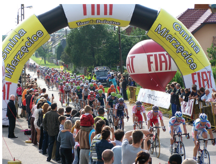
1 sierpnia światowa elita kolarstwa odwiedziła Mierzęcice.

Na całej trasie przejazdu nasi mieszkańcy mocno dopingowali zawodników, przygotowali flagi i szaliki w barwach narodowych. Zresztą podziękowania za wspa-