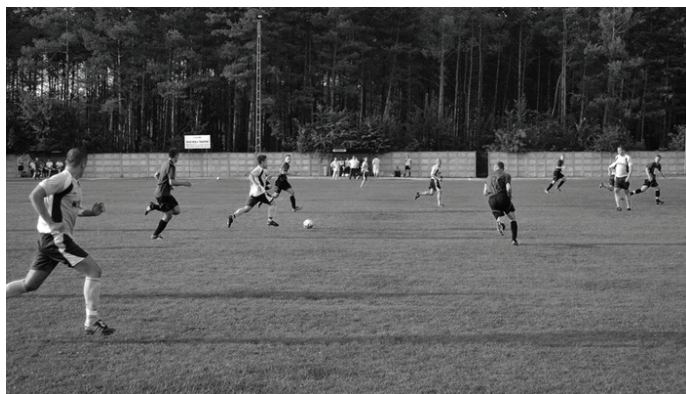
Po 13 kolejce „Strażak” Mierzęcice zajmuje 6 miejsce w tabeli.

stępną kolejkę „Strażak” przegrał z MKS Siemianowice Śląskie 2:1, potem była wygrana z LKS „Zgodą” Byczyna 4:1 i przegrana z AKS „Niwka” Sosnowiec. 1 października „Strażak” zremisował z MCKS Czeladź 3:3. Kolejny remis tym razem 2:2 odnotowano 8 października z LKS „Orzeł” Nakło Śląskie. W tym spotkaniu dla Mierzęcice dwa gole strzelił Sebastian Barto-