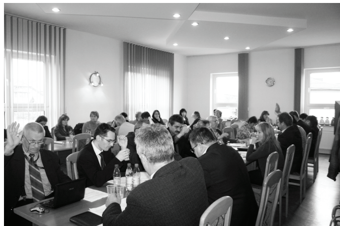
Dofinansowanie lekkiego samochodu pożarniczego dla jednostki Mierzęcice II radni poparli jednogłośnie.

Uchwała była zgodna z zapisami ustawy o systemie oświaty oraz z