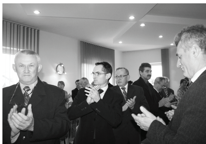
Wyróżnienie starościny, radni mierzęcickiej Rady Gminy nagrodzili oklaskami.