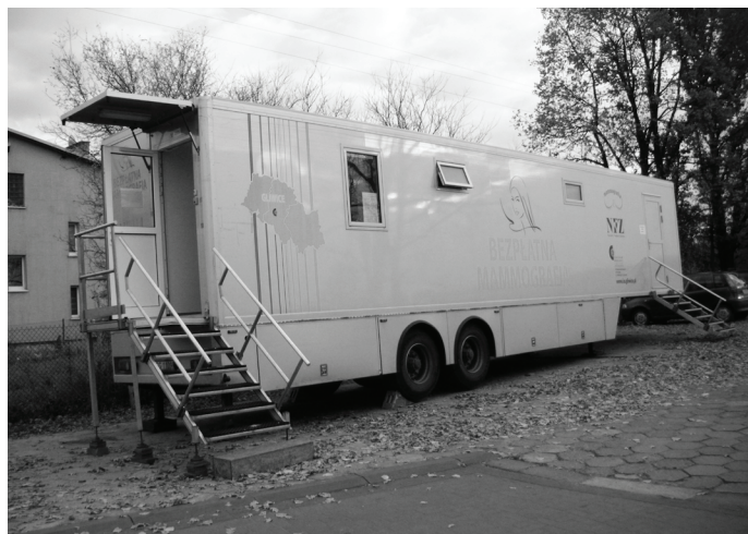
„Mammobus” stacjonował w Mierzęcicach 3 i 4 listopada tego roku.

się w gminie od kilku lat badania cieszą się dużym zainteresowaniem. W tym roku z oferty skorzystało ok. 80 osób.