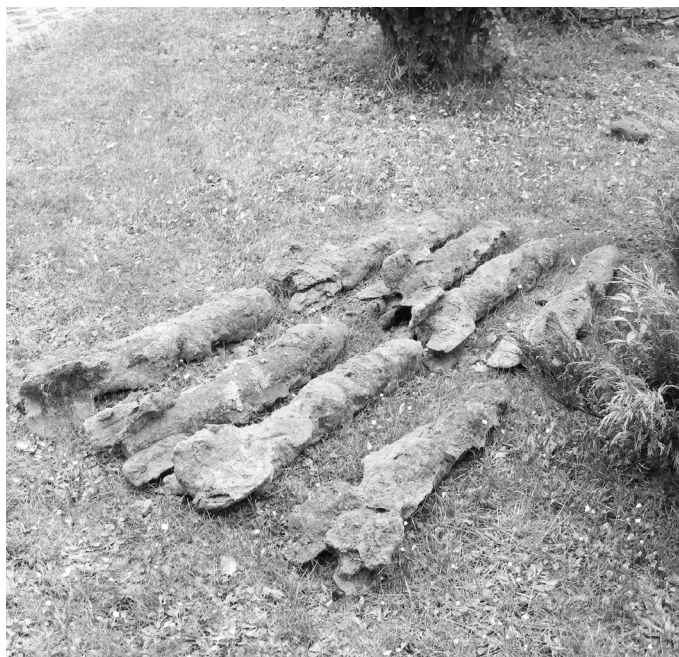
Ujawnione w Nowej Wsi niewybuchy pochodziły z okresu II wojny światowej.

Niewybuchy pochodziły z czasów II wojny światowej. W znalezisku znajdowało się ok. 15 przedmiotów. Były to m.in.: rakiety przeciwcieci samolotom o długości ok. 70