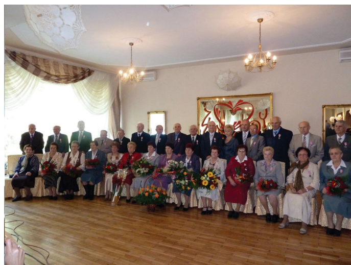
Pary, które obchodziły 50 i 60-lecie zostały uhonorowane m.in. Medalami Prezydenta RP.