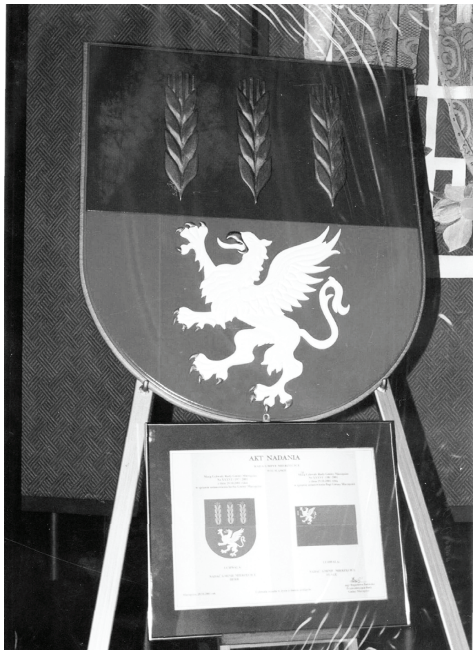
Insygnia gminy Mierzęcice, herb i flaga, zostały nadane w 2001 roku.