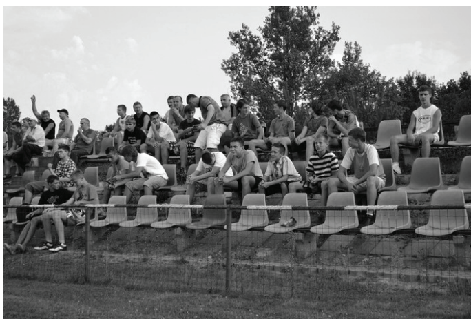
„Strażak” zawsze może liczyć na wierne grono kibiców.

„Brawo Strażak! Emocji oprócz bramek dodawał też sędzia... Tak