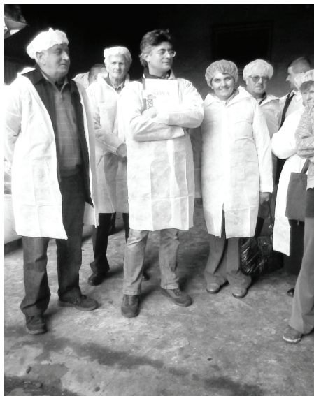
Wizyta studyjna w Żeliszławicach.