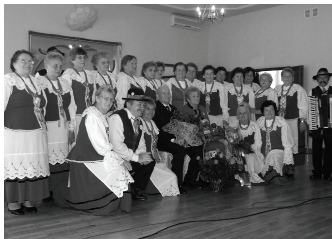
Zespół Śpiewaczy „Mierzęcanki”.

„Panorama Gminy Mierzęcice” Bezpłatny Miesięcznik Informacyjny