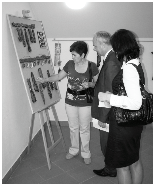
Wystawa prac rzeźbiarki w GBP w Mierzęcicach była pierwszą kompleksową prezentacją jej dzieł.