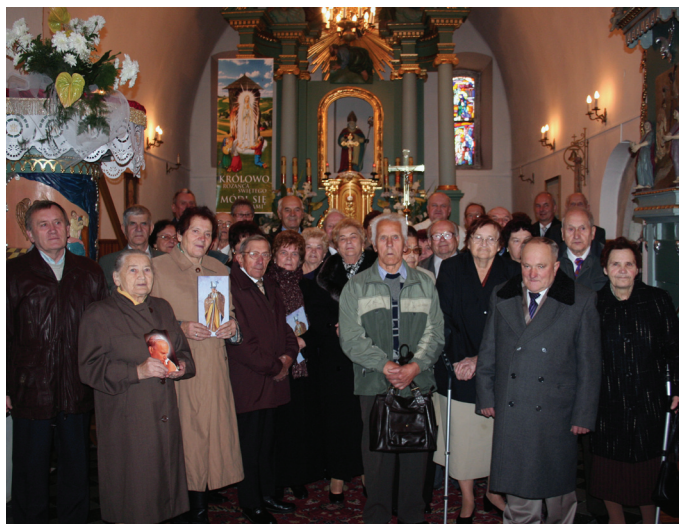
Pamiątkowe zdjęcie jubilatów wykonane w kościele św. Mikołaja w Targoszycach.