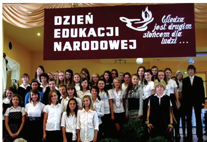
W części artystycznej wystąpiła młodzież z SP nr 1 i Gimnazjum w Mierzęcicach.