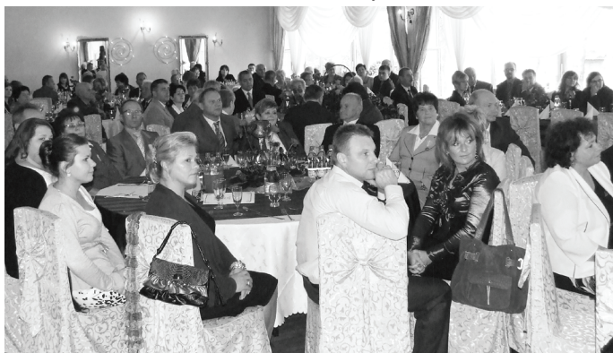
W drugiej części spotkania jubilaci mogli spędzić czas w gronie najbliższych.

Na zakończenie przygotowano część artystyczną. Obchody uświetnił występ: najmłodszych z SP nr 1 w Mierzęcicach, kapela „Mierzęcice” i Zespół Śpiewaczy „Mierzęcanki”.