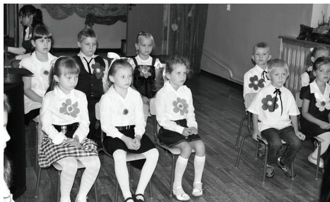
Pierwszoklasiści czuli się bardzo wyróżnieni czekając na pasowanie na uczniów.

W Szkole Podstawowej w Toporowicach odbyło się niedawno bardzo uroczyste pasowanie na ucznia, pierwszoklasistów. Najmłodszy szczerze ślubowali, że będą rzetelnie wypełniać obowiązki ucznia i obywatela.