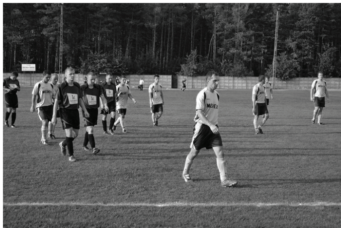
Mimo że „Strażak” gra pierwszy sezon w „okręgówce” wygrywa większość spotkań.

-Wygraliśmy zasłużenie. Szkoda tylko, że wcześniej nie zapewniliśmy sobie większej przewagi bramkowej, co zaoszczędziłoby