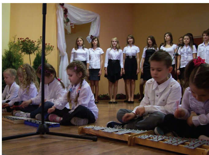
Występy najmłodszych zrobiły wrażenie na zebranych.