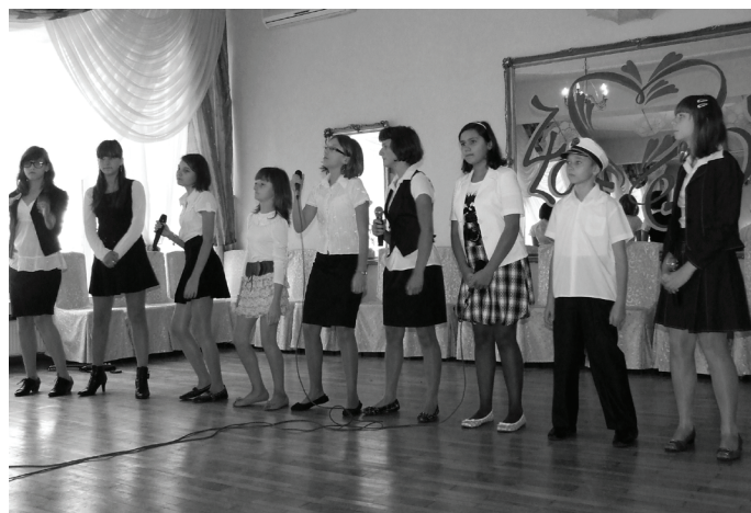
Występ uczniów SP nr 1 w Mierzęcicach.