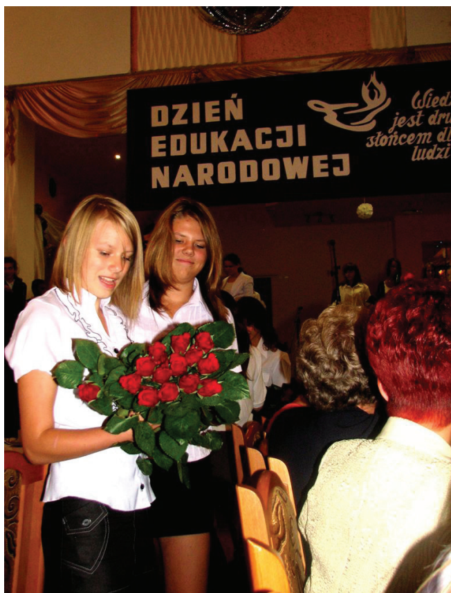
Młodzież przekazała swoim nauczycielom wspaniałe kwiaty.

wych życzenia, wyraził wdzięczność za trud nauczania i wychowania, który owocuje wieloma sukcesami zarówno uczniów jak i nauczycieli.