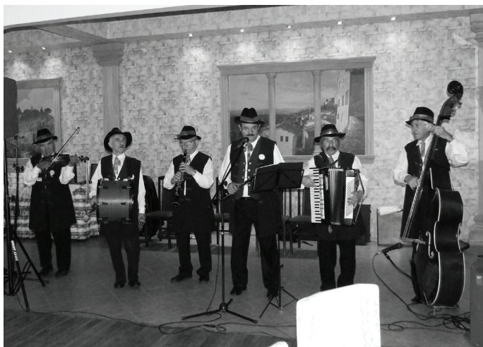
Występ kapeli „Mierzęcice”.