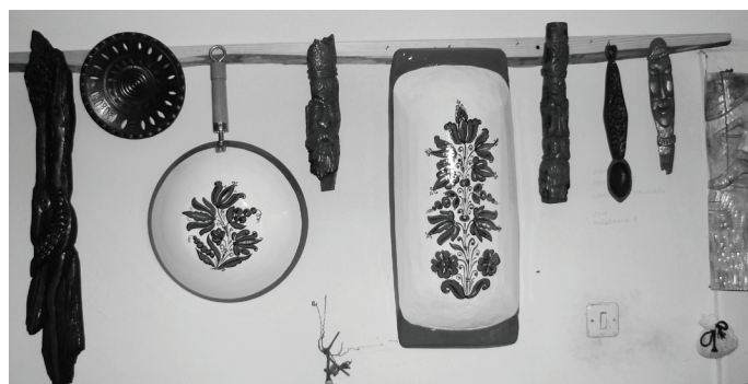
Artystka najchętniej prezentuje motywy ludowe - węgierskie - i naturę, ptaki, kwiaty, drzewa.