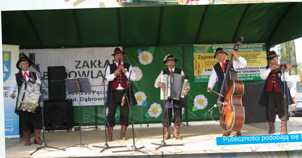
Publiczności podobają się barwne i żywiolowe występy zespołów.

Natomiast w terminie od 1 do 3 maja tego roku odbywał się w Zebrzydowicach Międzynarodowy Przegląd Zespołów Regionalnych „Złoty Klos”. Zespół „Mierzęcanki” otrzymał wyróżnienie na 129 grup biorących udział w tym prestiżowym przeglądzie.