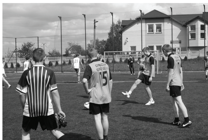
W czasie turniejów na „Orliku” panowała świetna atmosfera.

Drugi Turniej o Puchar Komandorii Zagłębiowskiej Orderu św. Stanisława, rozegrano systemem każdy z każdym, wzięły w nim udział drużyny gimnazjalistów z Nowej Wsi, Mierzęcic, Siewierza, Psar i Wojkowic Kościelnych. Pierwsze