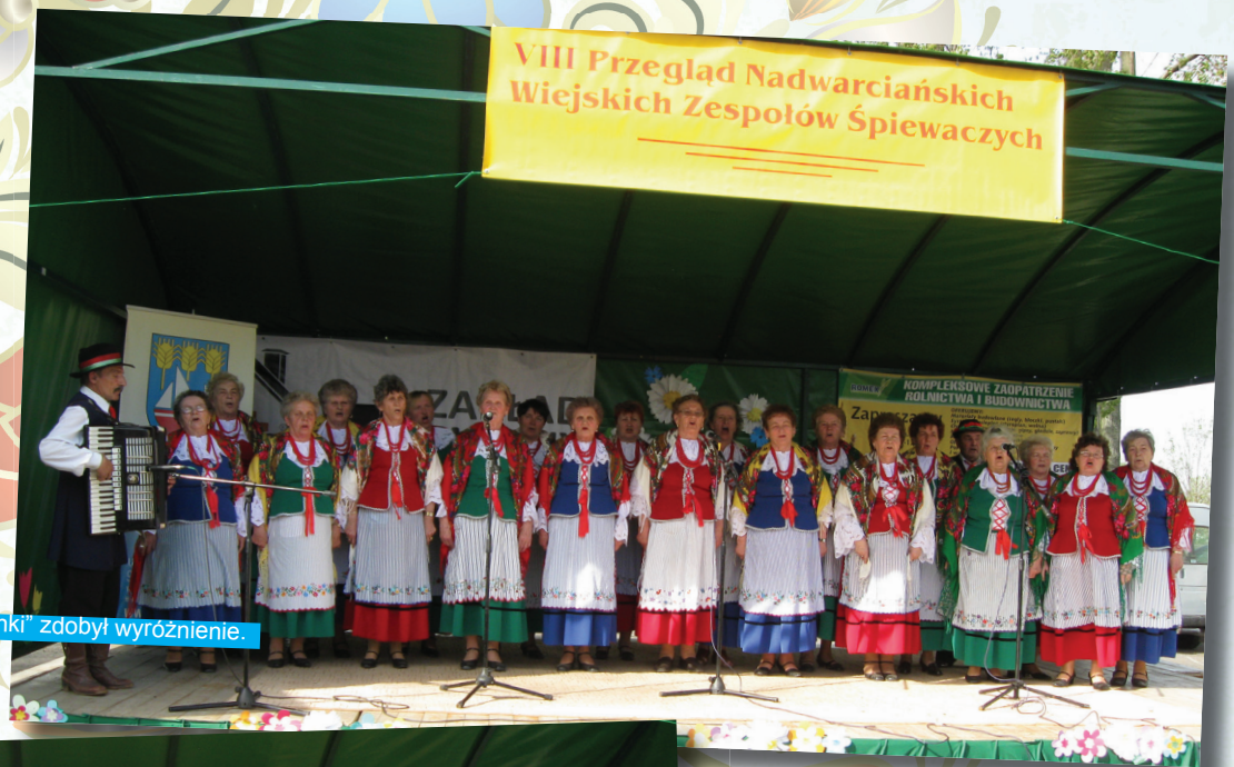
W Brzegu zespół „Mierzęcanki” zdobył wyróżnienie.

VIII Przegląd Nadwarciańskich Wiejskich Zespołów Śpiewaczych odbył się w Brzegu, 29 kwietnia tego roku. Zaprezentowały się w jego trakcie zespoły z woj. łódzkiego, wielkopolskiego, śląskiego i lubelskiego. Naszą gminę reprezentowały: Zespół Śpiewaczy „Mierzęcanki” i Kapela Regionalna „Mierzęcice”. Występy podobały się publiczności.