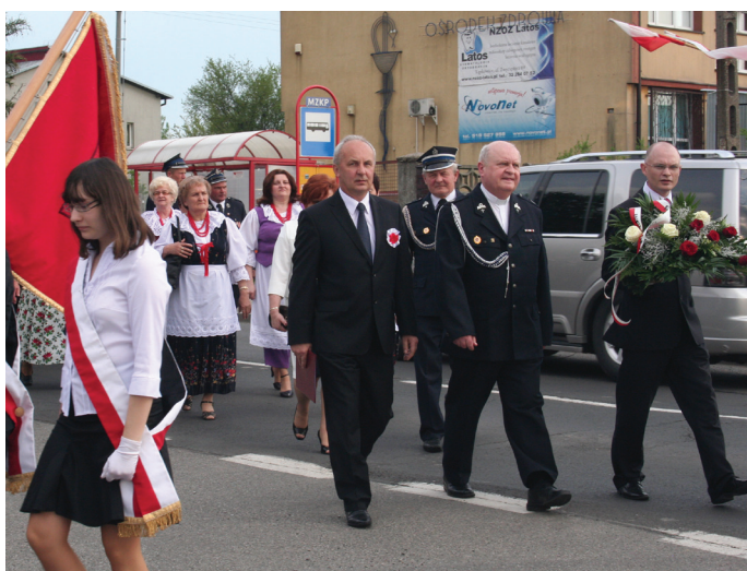
Zebrani w uroczystym pochodzie przemaszerowali pod Pomnik Niepodległości w Mierzęcicach.

Bardzo uroczysto świętowano w gminie Mierzęcice 221. rocznicę uchwalenia Konstytucji 3 Maja. Uroczystości rozpoczęła msza święta „Za ojczyznę”, następnie zebrani przemaszerowali w pochodzie do Mierzęcic, gdzie złożono kwiaty pod Pomnikiem Niepodległości. (artykuł na str.4)