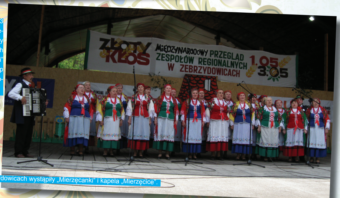
Podczas przeglądu w Zebrzydowicach wystąpiły „Mierzęcanki” i kapela „Mierzęcice”.

Natomiast w terminie od 1 do 3 maja tego roku odbywał się w Zebrzydowicach Międzynarodowy Przegląd Zespołów Regionalnych „Złoty Klos”. Zespół „Mierzęcanki” otrzymał wyróżnienie na 129 grup biorących udział w tym prestiżowym przeglądzie.