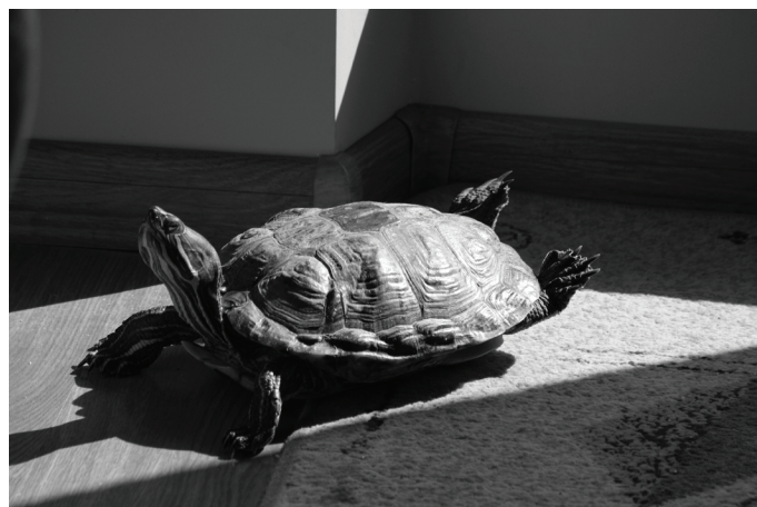
W Polsce żółw czerwonolicy pochodzący z Kalifornii to populamy domowy pupil. Niestety często bywa wypuszczany do rzek i jezior.

-Zmienia się szata roślinna, zanika część łąkowa w wyższych partiach gór, wyparta przez las świerkowy. A to oznacza brak miejsca do życia dla wielu gatunków zwierząt. Jest mniej lasów bukowych, więc nie mają gdzie gniazdować związane z buczynami - ptaki. Właściwie na naszych oczach z miejskich osiedli zniknęły stada popularnych niegdyś wróbli. Ptaki nie mają gdzie zakładać gniazd, bo zmalała liczba podmiejskich parków i zagajników. „Zieloną otulinę” zastąpiły osiedla mieszkaniowe rozrastających się metropolii. W Polsce ofiarami działalności człowieka są też