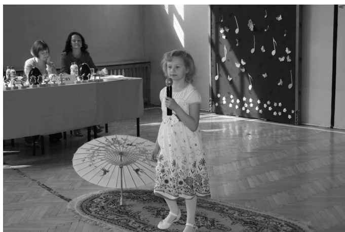
Najmłodszy ładnie prezentował się na scenie.