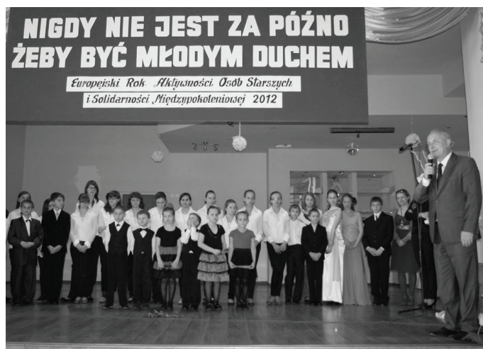
Koncert inauguracyjny obchody Europejskiego Roku Aktywności Osób Starszych i Solidarności Międzypokoleniowej podobał się zebranych.