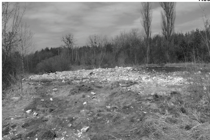
Teren został uporządkowany.