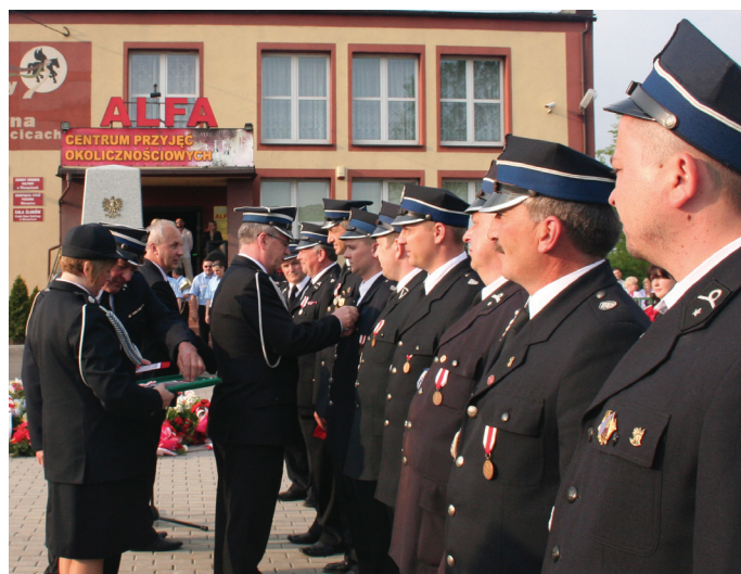
Z okazji Dnia Strażaka w gminie Mierzęcice nagrodzono najaktywniejszych druhów.

3 maja w gminie Mierzęcice obchodzono Dzień Strażaka. Z tej okazji najaktywniejszym druhom wręczono medale: złote, srebrne i brązowe „Za zasługi dla pożarnictwa” i „Wzorowy strażak”. Wyróżnienia wręczono w obecności przedstawicieli wszystkich gminnych OSP. (artykuł na str. 2)