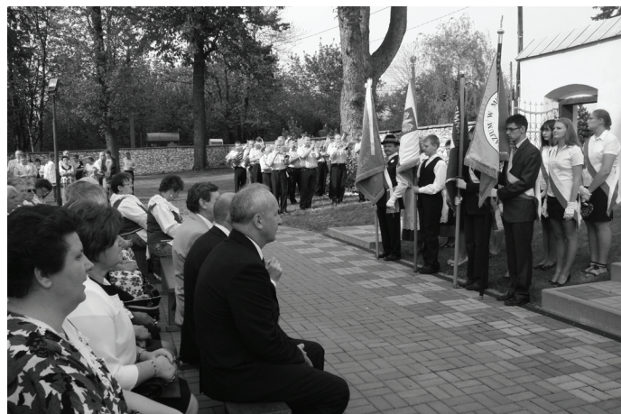
3 maja obchody rozpoczęła uroczysta msza „Za ojczyznę”.