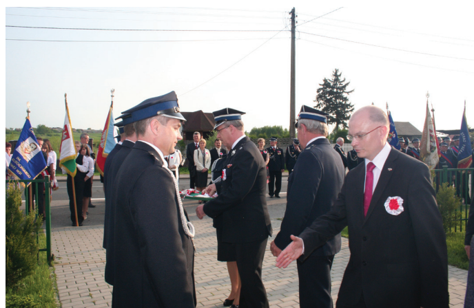
Strażacy otrzymali złote, srebrne i brązowe medale „Za zasługi dla pożarnictwa”.

Najbardziej aktywnym strażakom wręczono odznaczenia złotych, srebrnych i brązowych medali „Za zasługi dla pożarnictwa” oraz „Wzorowy strażak”. Dekoracji do-