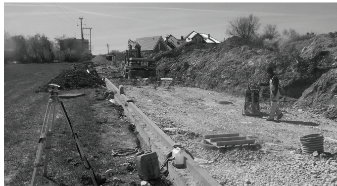
Prace przy budowie ul. Zjazdowej postępują teraz szybko.