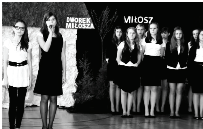
W czasie uroczystości zaprezentowano utwory polskiego poety.