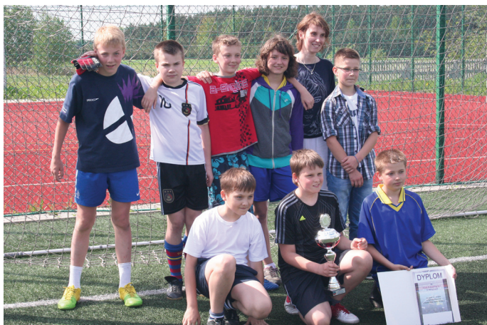
Gminę w „Euro Cup Brynica 2012” będą reprezentować m.in. zdobywcy I miejsca drużyna SP nr 1 w Mierzęcicach.

Wszystkim Mamom mieszkającym na terenie gminy Mierzęcice i ich Pocięchom - z okazji Dnia Matki oraz Dnia Dziecka życzymy tylko szczęśliwych chwil, spełnienia marzeń oraz wszelkiej pomyślności