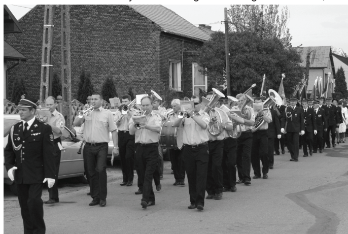
Uroczysty pochód prowadziła Gminna Orkiestra Dęta.