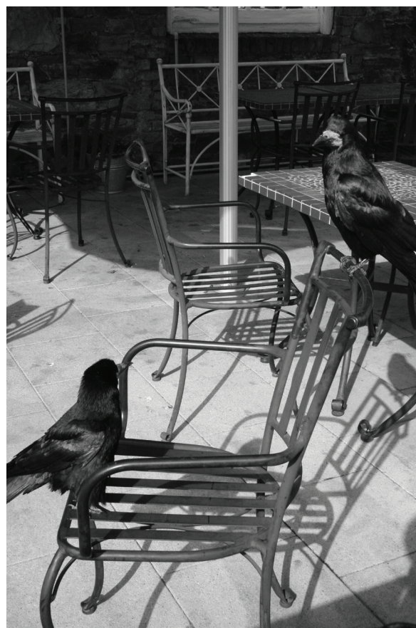
Działalność człowieka sprawia, że zwierzęta zmieniają swój tryb życia.

żółwie błotne, które mają w kraju coraz mniej siedlisk. Reintrodukcje tych gadów nie sprawdziły się. Wypierają je żółwie czerwonolicy, wpuszczane do zbiorników wodnych przez znudzonych zwierzętami hodowców. Czerwonolicy mimo że pochodzą z ciepłej Kalifornii doskonale adaptują się do naszych warunków, niszcząc polską faunę. -Czy zmiany w świecie roślin i zwierząt są nieodwracalne?