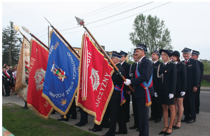
Obchody były uroczyste towarzyszyły im poczty sztandarowe m.in. jednostek OSP oraz placówek oświatowych.

i przyjemności oraz przeżyć życie w spokoju... albo, czyniąc się użytecznym wszystkim ludziom, nieść pomoc i ratunek tym, którzy tego potrzebują”. Wszystkim, którzy nieśli pomoc innym i spieszyli na ratunek w każdej potrzebie pragnę szczególnie dzisiaj podziękować. Te podziękowania kieruję do druhen i druhów z naszych OSP, którzy w dniu świętego Floriana obchodzą swoje święto. Z tej oka-