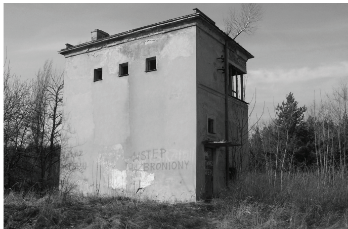
Budynek dawnej nastawni zagrażał bezpieczeństwu, dlatego go usunięto.