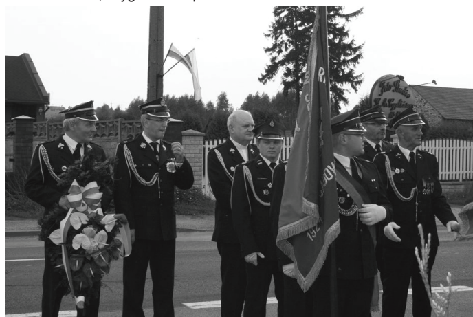
Obchodom towarzyszyły także poczty sztandarowe.