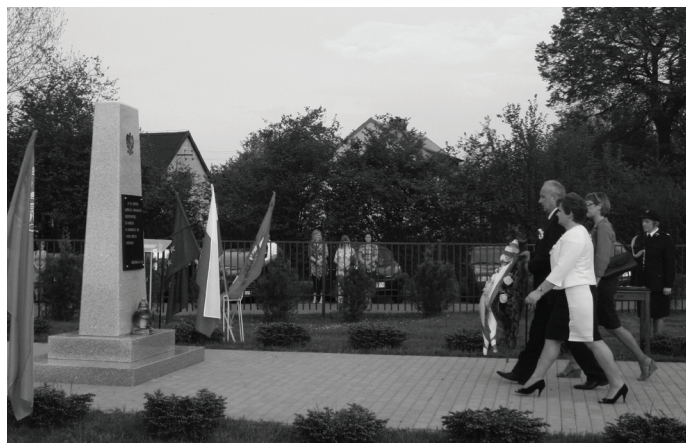
Pod pomnikiem złożyli kwiaty m.in. przedstawiciele władz gminy.