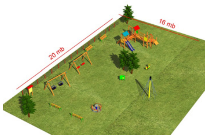
Przykładowe rozmieszczenie urządzeń zabawowych w Boguchwałowicach

Trzecie i czwarte przedsięwzięcie ma szansę zostać dofinansowane w ramach „Odnowy i rozwoju wsi” Programu Rozwoju Obszarów Wiejskich na lata 2007 – 2013.