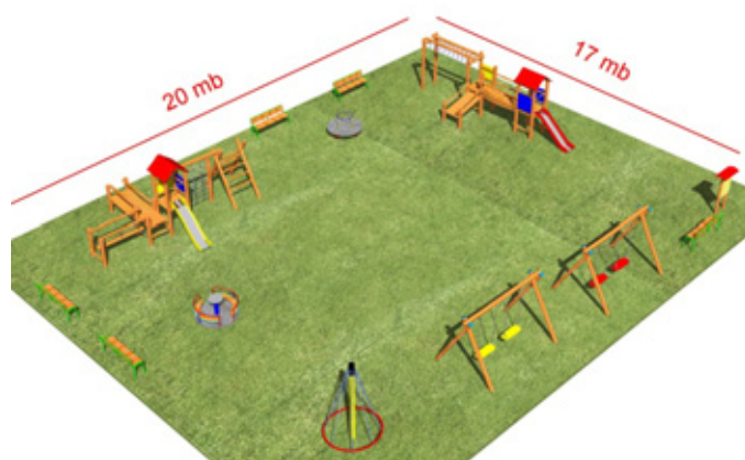
Przykładowe rozmieszczenie urządzeń zabawowych w Toporowicach