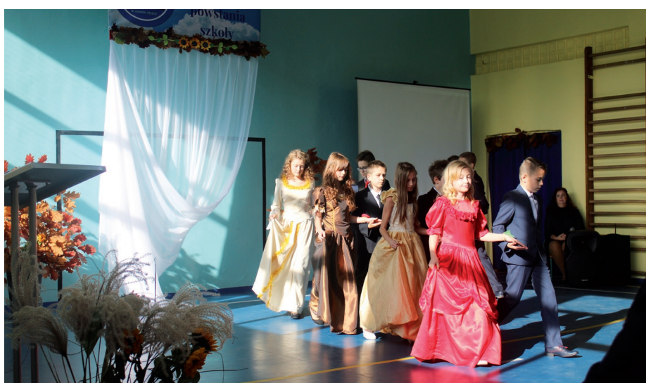
Poloneza czas zacząć...