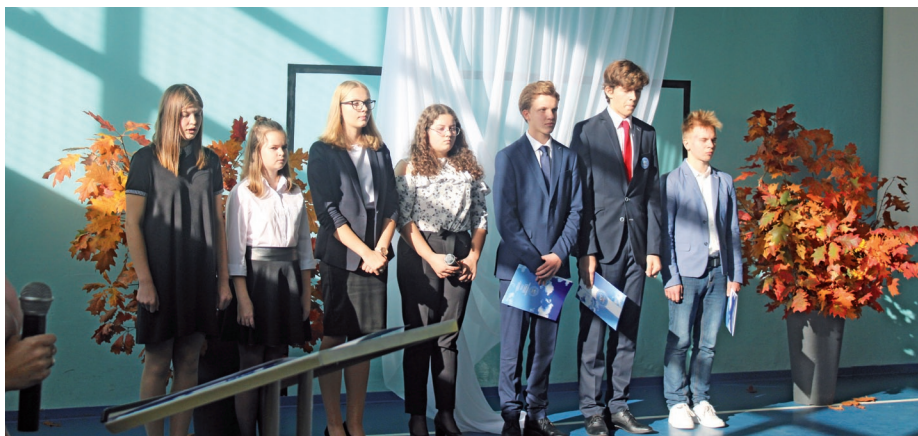
Program artystyczny w wykonaniu uczniów i absolwentów.

Jubileuszowe obchody rozpoczęły się od mszy świętej w kościele pw. św. Antoniego w Nowej Wsi, w której wzięli udział przedstawiciele władz gminy, grono pedagogiczne oraz zaproszeni goście. Po części sakralnej uroczystość przeniosła się do budynku szkoły, gdzie na gości czekali uczniowie oraz absolwenci ze specjalnie przygotowanym na tę okazję programem artystycznym.