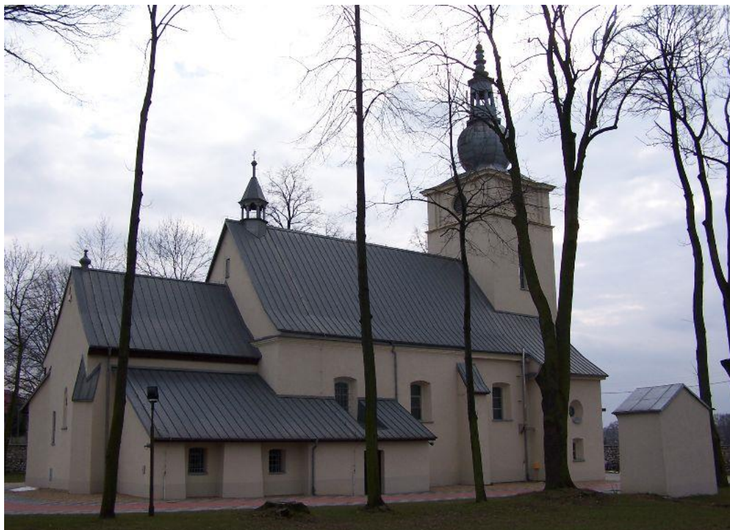
Kościół w Targoszycach