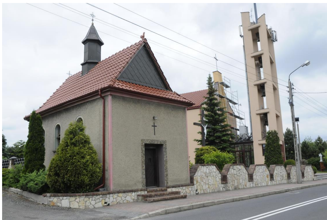
Kaplica w Nowej Wsi